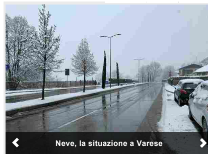
Neve, la situazione a Varese

LA MOSTRA – Il percorso espositivo propone in una delle due Sale parte dei lavori di Maria Lai e la proiezione di Ansia d’infinito e nell’altra Sala le opere di Franca Sonnino e i disegni inediti di Maria Lai. Quadri delicati con il filo come protagonista come accade in Collage 1 e 2, 1995 –opera che è anche l’immagine guida dell’intera mostra, Albero con Pagine, 2006, Scritture su stoffa, 2006 e Geografia